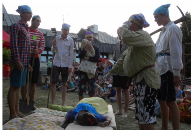
... ale trpaslíci na to přišli a Sněhurka obživila ...