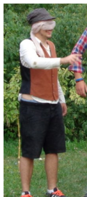
... Bystrozraký ...