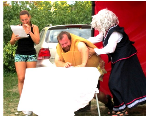
... něco uválela a dala vychladnout ...