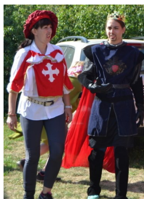
... a už jsou tu nápadníci ...