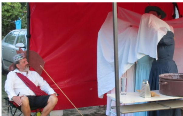
... když Zlatovlásku poznáš, tak si ji ...