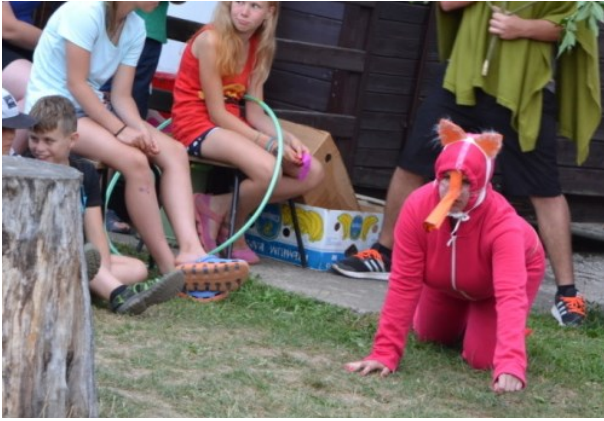
... a nakonec lišku ...