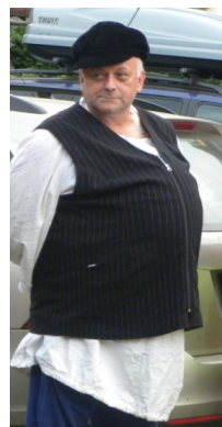
... Široký ...