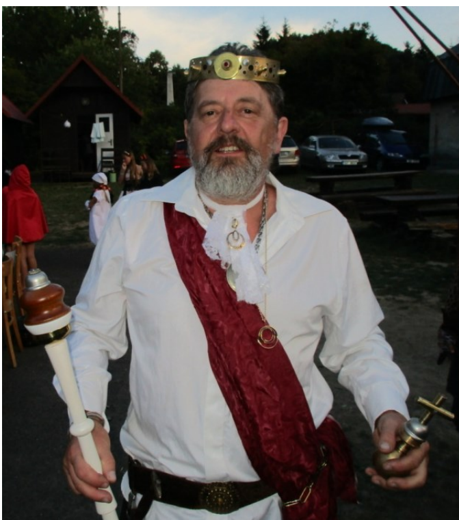
Král pohádek Vlastík První