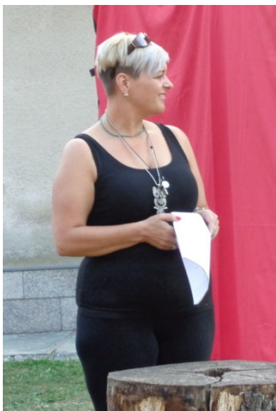
Rejža – despota