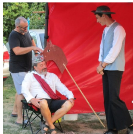
... mám dceru, mám, ale ne jednu ...