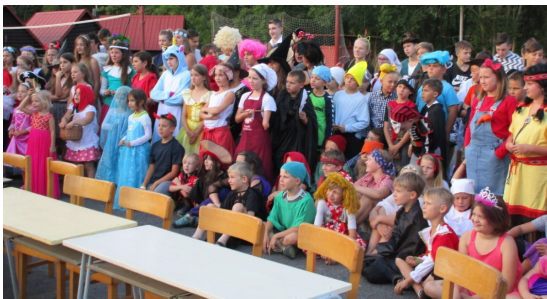
Obyvatelé Pohádkové říše