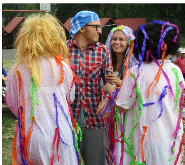
Jezinky chytly Smolíčka ...