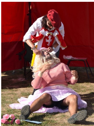
... a povedlo se ...