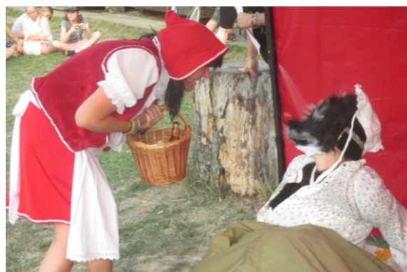
... a už číhá na Karkulku, kterou taky sežere ...