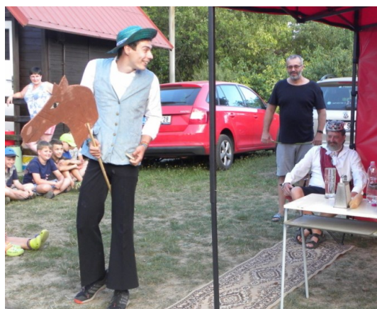
... dojel k otci nevěsty ...