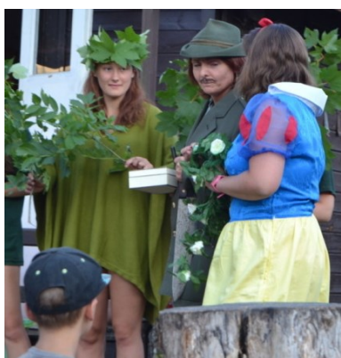
... Sněhurka ale myslivce ukecala ...