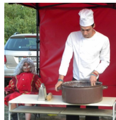
... upěci vzácného hada ...