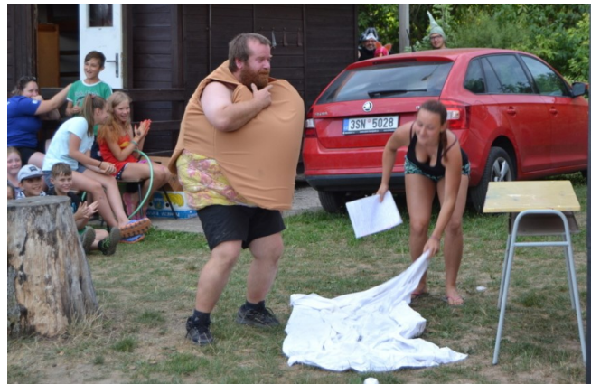
... a už ho bere k lesu ...