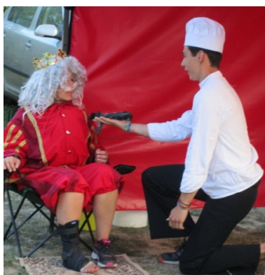
... a dát králi ke sváče ...