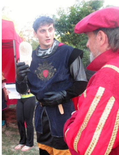
... ale zůstal po ní jen střívěček ...