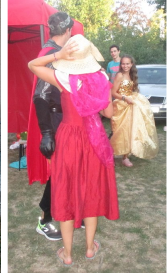
... ale jak ji uviděl ...