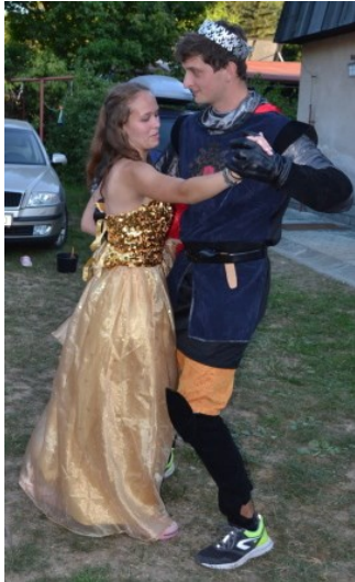
... už tančil jen s ní ...