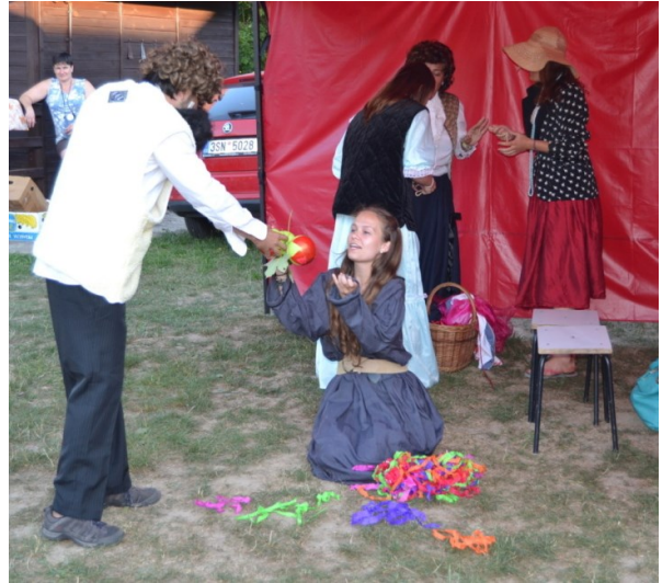
... tumáš něco z cest ...