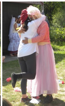
... a tak si ji hned vzal za ženu ...