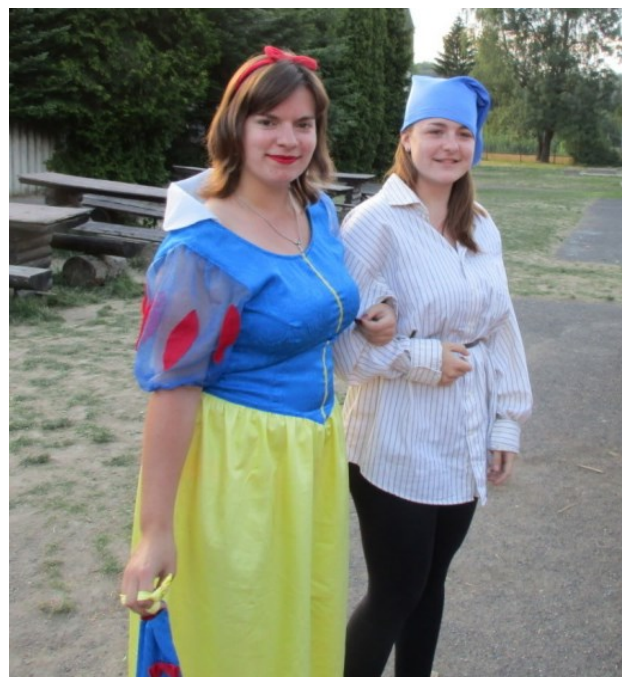
Sněhurka II. s posledním žijícím trpaslíkem