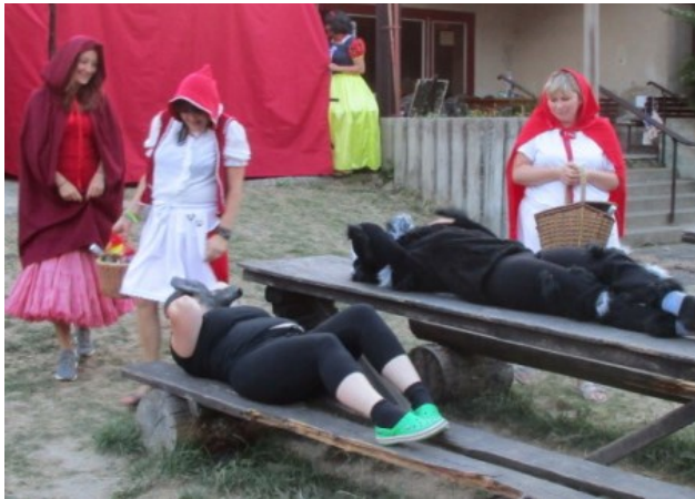
zdvojená červená Karkulka ....