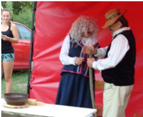
... se jednou rozhodli, že si upečou Koblížka ... a babka nešika ...