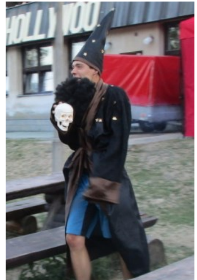
opomenutý černokněžník ...