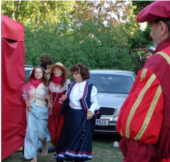
... a hurá na královský ples ...