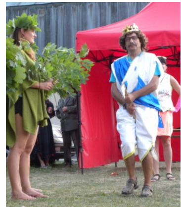
... královna je tu zas – s otráveným jablkem a na to už byli trpaslíci krátcí – a tak vyráží švarný zachránce ...