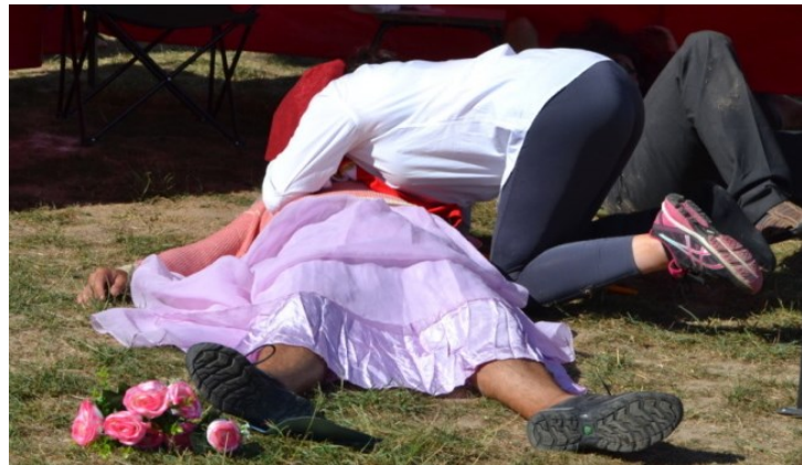
... tak to zkusil s umělým dýcháním ...