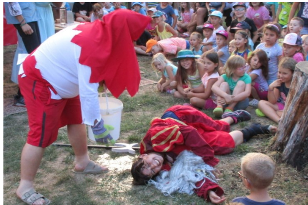
... a ani mrtvá a ani živá voda nepomohla ...