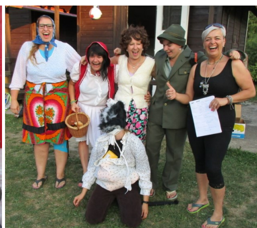
... a spokojené hérečky ...