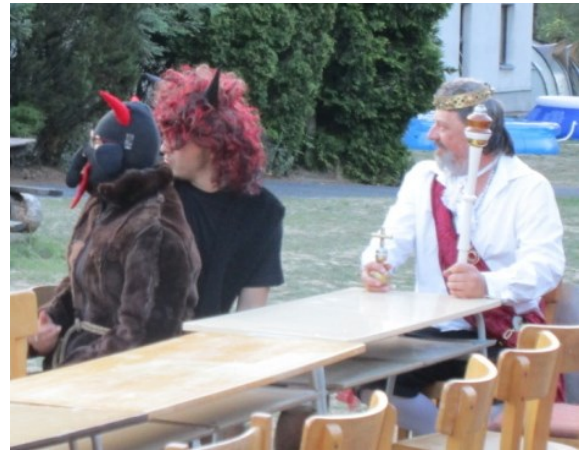
... a první u stolu – samozřejmě čerti