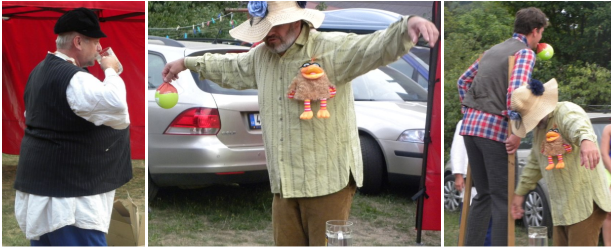
... ale společně je všechny spolu zvládli ...