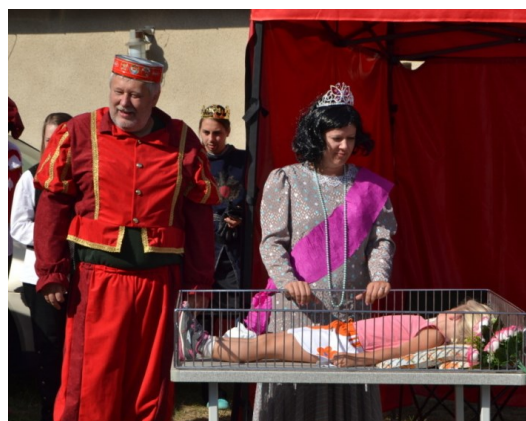
... a tak si udělali holčičku - Růženku ...