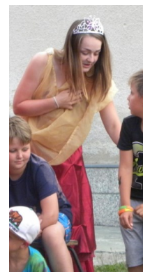
... princezna ...