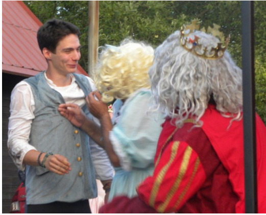
... pomocí mrtvé a živé vody a Jiřík byl krásnější...