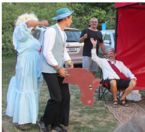
... tak teda sbohem ...