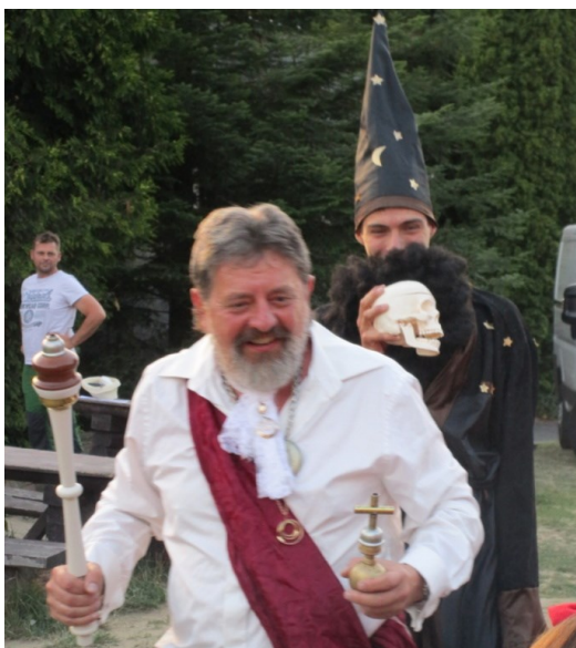
-... zaklel Krále pohádek ...