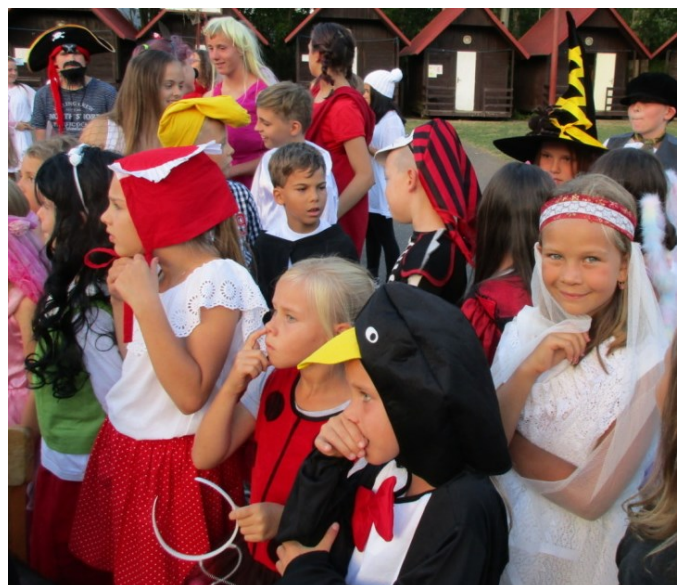
... a etapová hra začíná ....