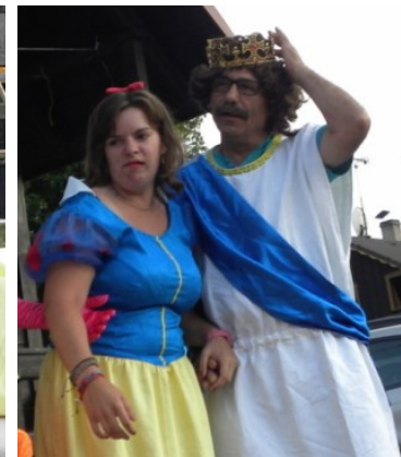
... a vše dobře dopadlo.