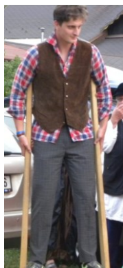
... Dlouhý ...