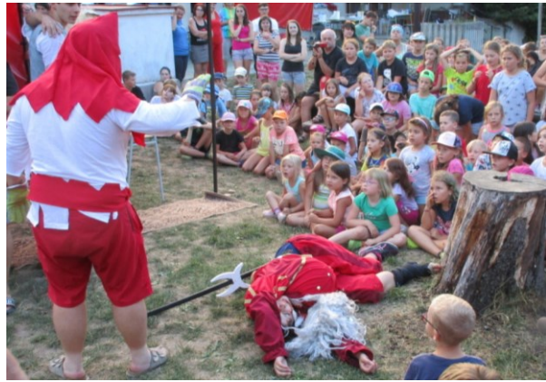
... ale kat obrátil pořadí ...