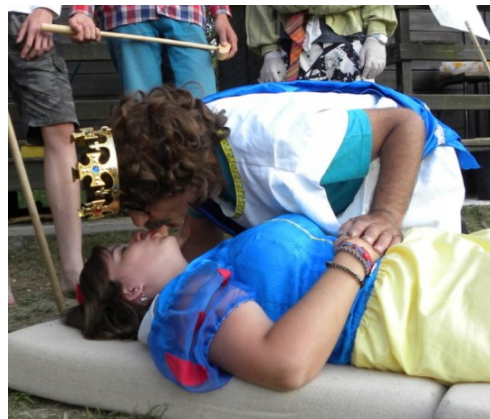
... moc se s tím nepáral...