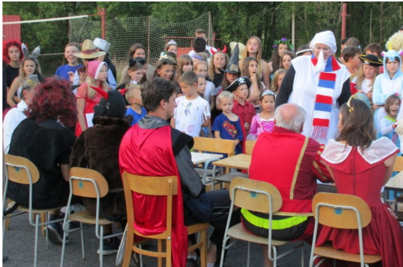
hosté u slavnostní tabule