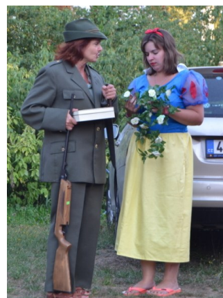
... tak pojd', jdem do lesa ...