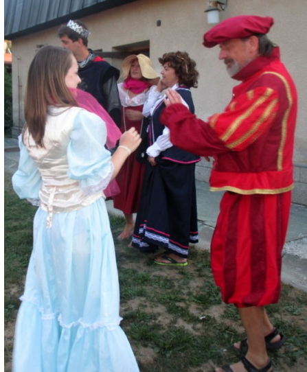
... taneček s králem ...