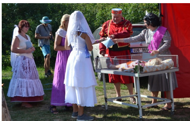
... které jí přály jen to nejlepší ...