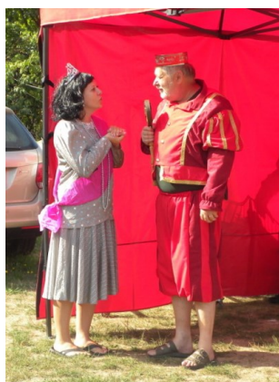
... Král s královnou neměli co na práci ...