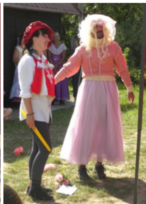
... to bylo radosti ...