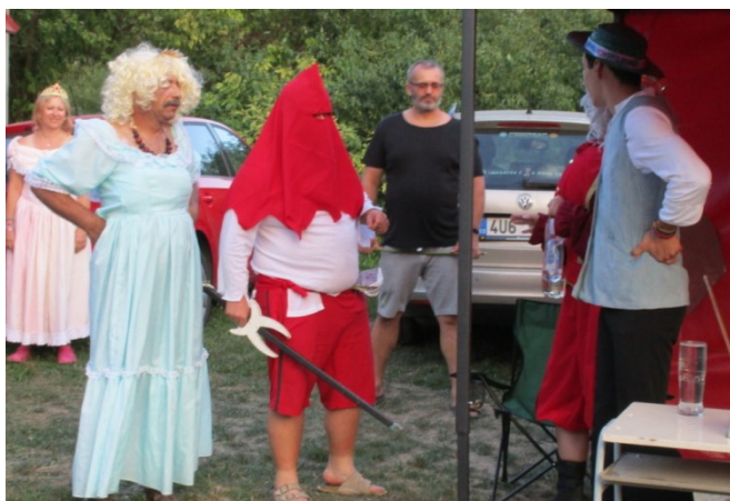
... král místo odměny na něj zavolal kateř ...