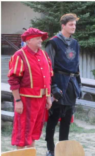
Princové Banene a Bajaja