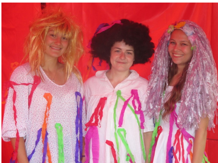
Jezinky v celé své kráse