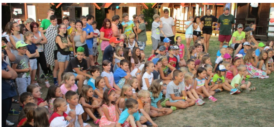
... a veselé diváctvo.