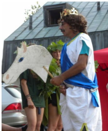
... na bujném oři ...