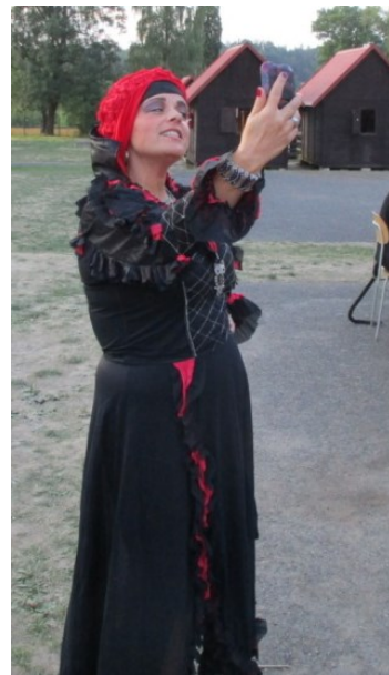
zlá královna I.