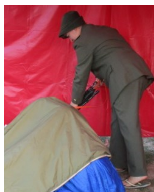
... všechny nakonec zachrání myslivec ...