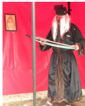
... ten se jí ale nechtěl vzdát a stanovil jim úkoly...