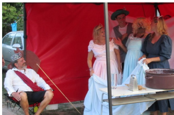
... a Jiřík s dopomocí poznal ...