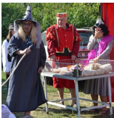
... až na tu poslední ...