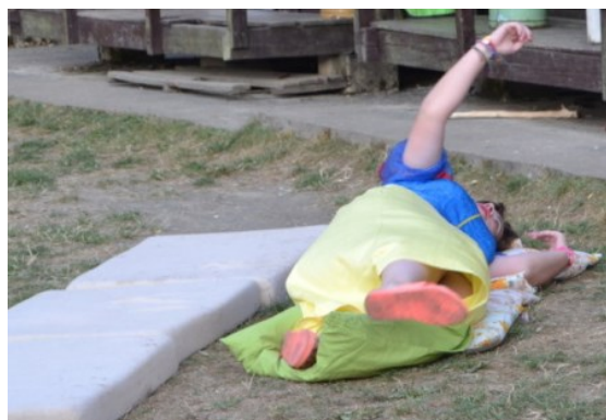
... Sněhurka zatím našla chaloupku ...