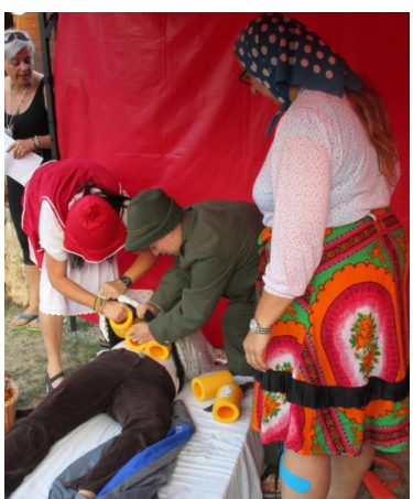
... a vlkovi zašijí do břicha kameny ... nacpanej vlk ...