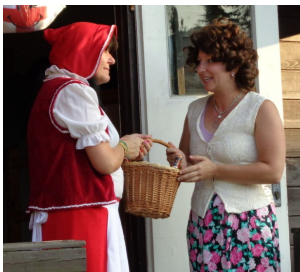
Maminka vysílá Karkulku k babiče ...