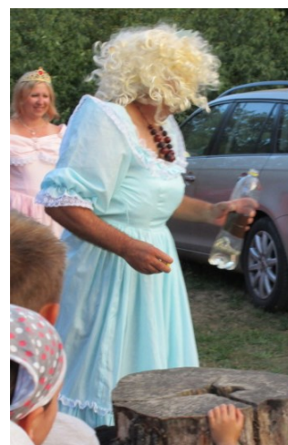
... ale Zlatovláska si ho obživila ...