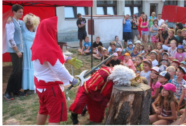
... což chtěl zlý král taky a tak se nechal stít ...