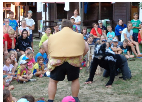
... kde potká vlka, kterému uteče ...