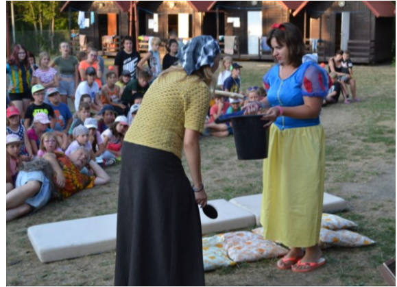
... královna ji však objevila a dala jí otrávený hřeben ...