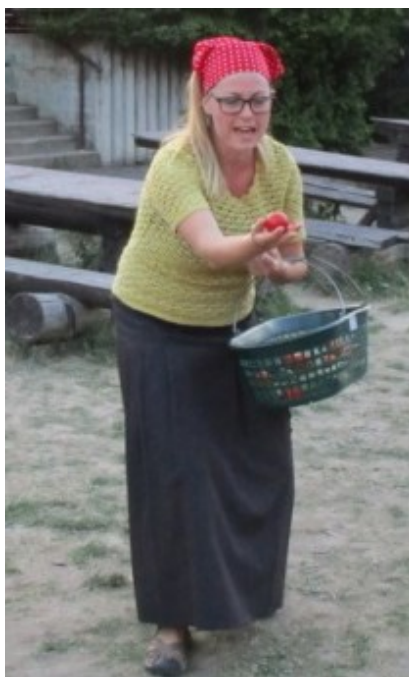
zlá královna II.