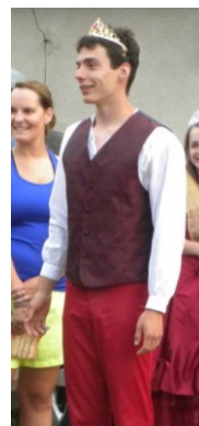
... princ ...