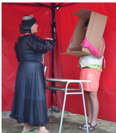
... Zrcadlo, kdo je na světě nej ...