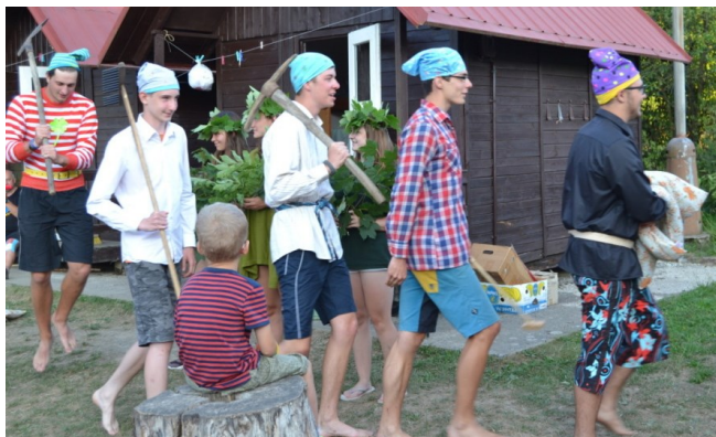
... která patřila trpaslíkům, kteří se divili, co se jim to v chaloupce usadilo – ale vygooglili si to v knížce ...