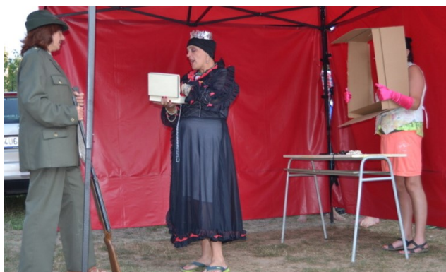
... jehož srdce královně donesl ...