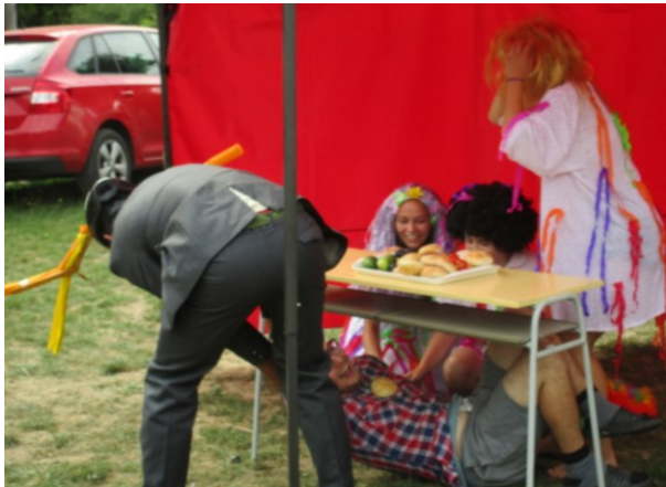
Jelen zachraňuje Smolíčka ...