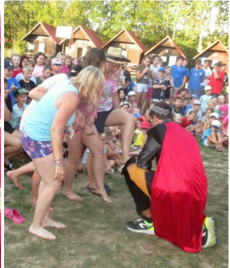
... to bylo zájemkyň o zkoušení ...