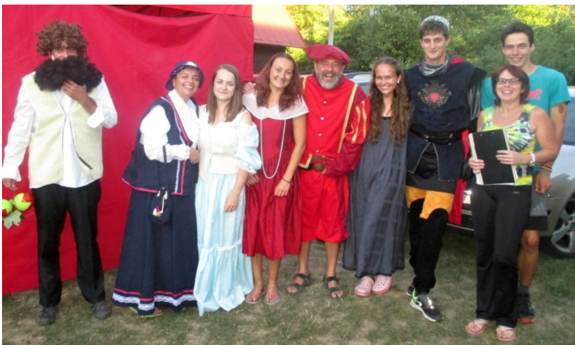
... ale to už bude asi jiná pohádka ...