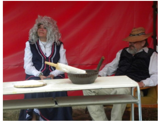
... dědek s babkou ...