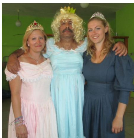
Zlatovláska a její sestry