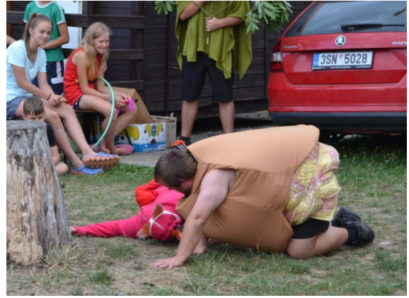
... které skočí na lep ...