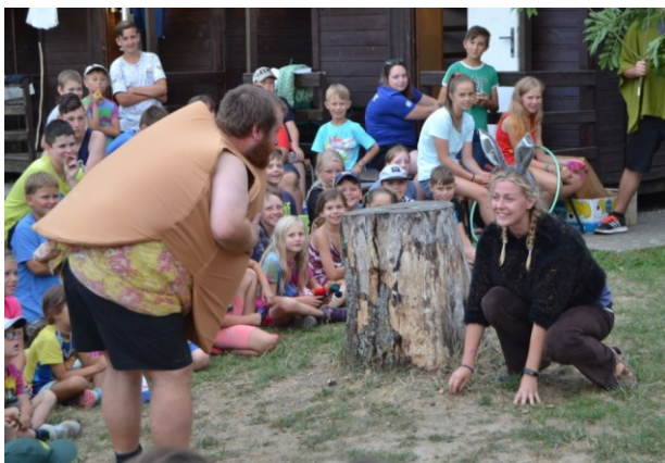
... kde potká zajíčka, kterému uteče ...