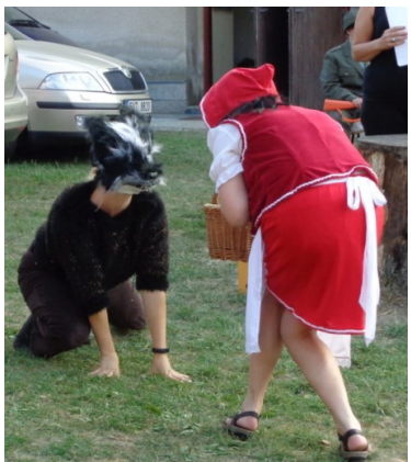
... kde potká vlka ...