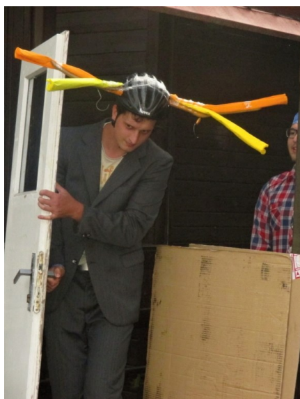
Jelen se zlatými parohy