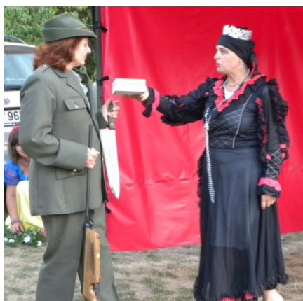
... a přineseš mi její srdce ...