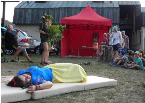
... a se Sněhurkou to hned seklo ...