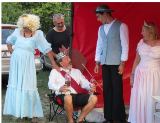
... od krále pak kromě Zlatovlásky dostal i živou a mrtvou vodu ...