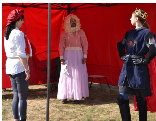
... kteří se o Růženku ucházejí ...