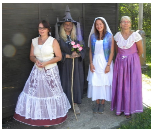
... na kterou se přišly podívat i víly ...