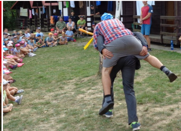
.... a už si ho odnáší domů