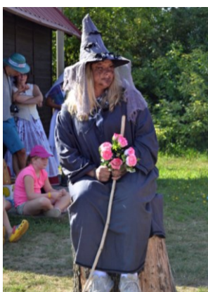
... ale zlá víla nakonec dosáhla svého ...