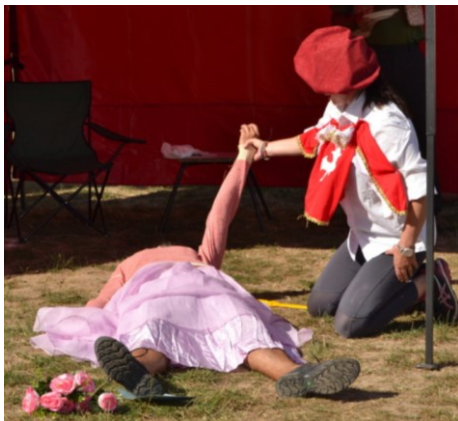
... ale princezna byla tuhá ...