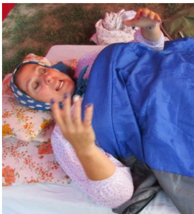
... zatím babička v klidu odpočívá ...