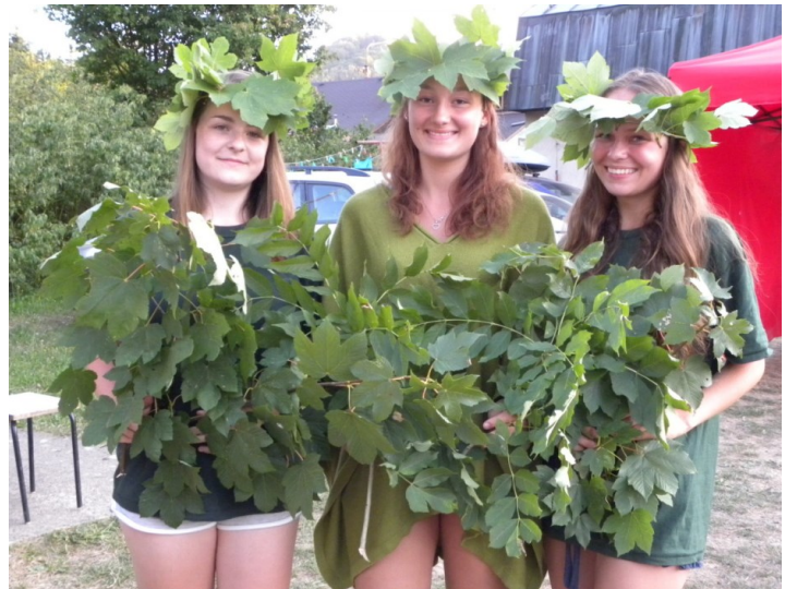
fakt hustej les