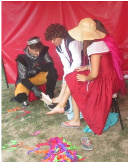
... i k povedené rodince se dostal ...