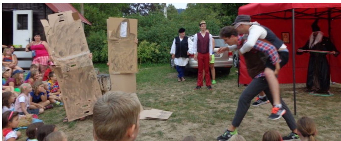
... a tak se princ s kamarády vydal tyto náročné úkoly plnit ...