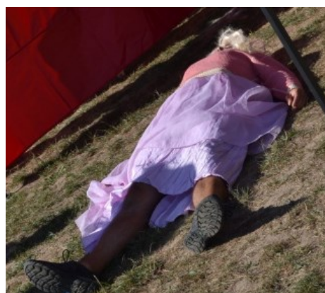
... a Růženka usnula hlubokým spánkem ...