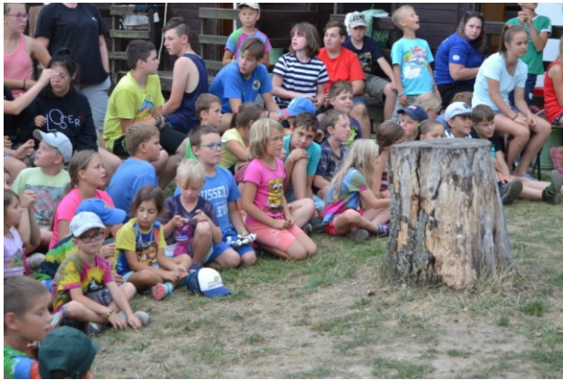
... dychtivé obecenstvo ...