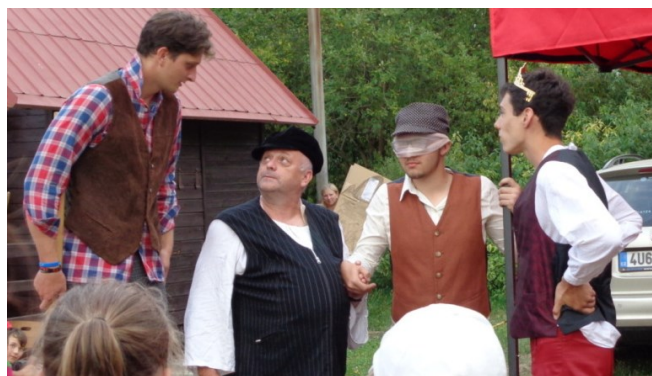
... a vydal ji za pomoci kamarádů osvobodit z moci čaroděje ...