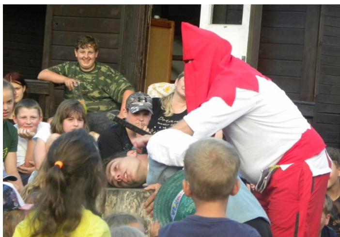
... a ten mu ušmik hlavu ....