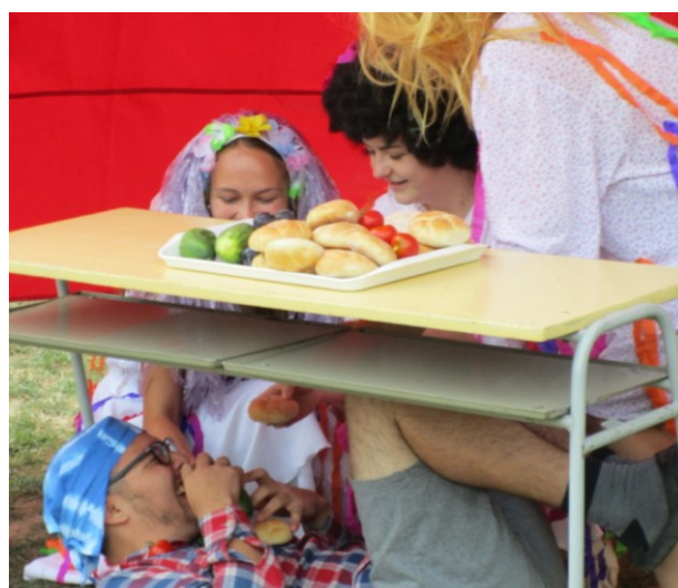
... a už si ho vykrmují