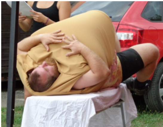
... ale Koblížek jak byl kulatý, se svalil dolů ...