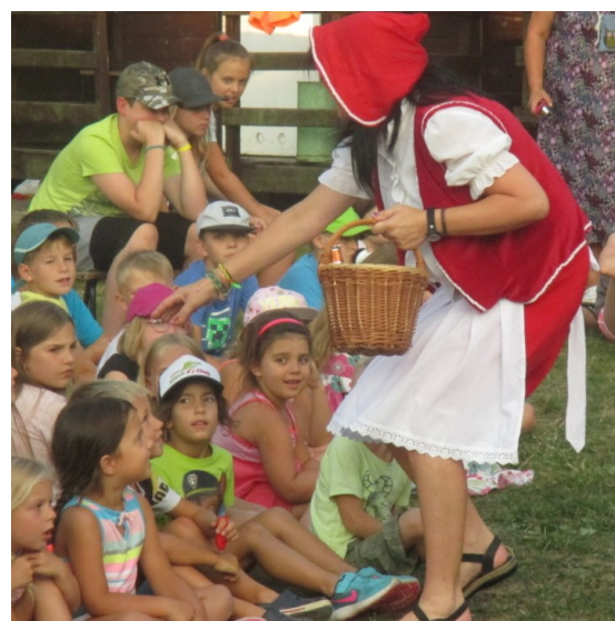
... Karkulka bloudí lesem ...