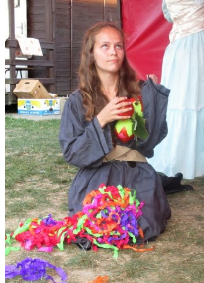
... mám, nemám, mám ...