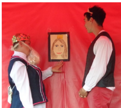
Princi se zalíbila jedna princezna ...