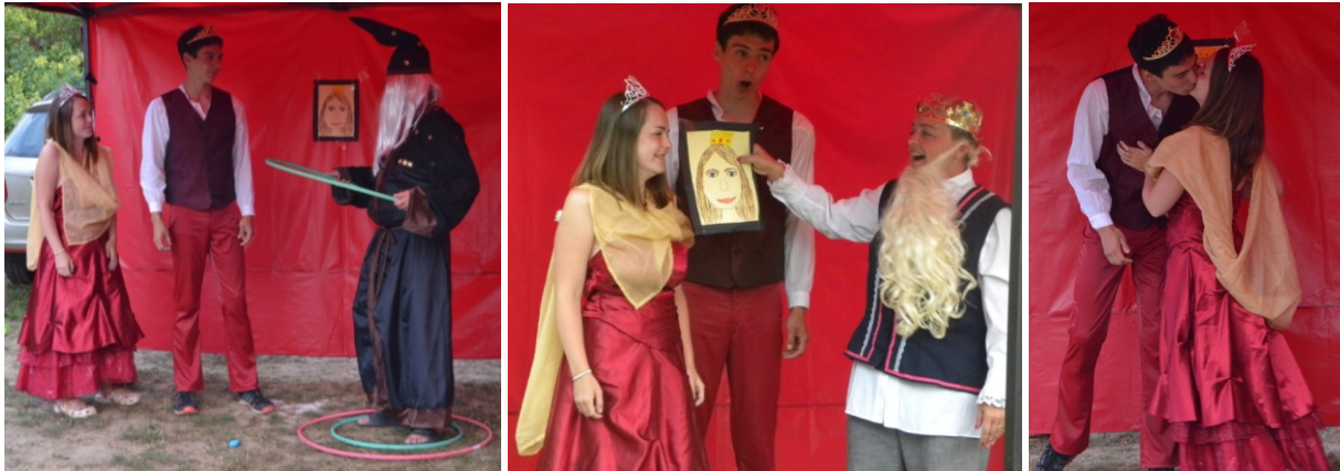
... po splněním úkolu čarodějovi praskla jedna z obručí a jelikož tak praskly všechny, tak to dobře dopadlo...