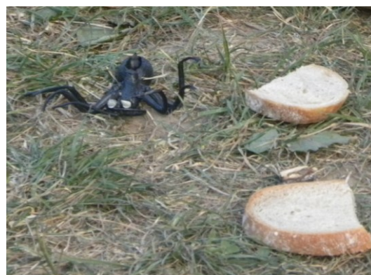
... po cestě pomohl mj. pavoukům ...