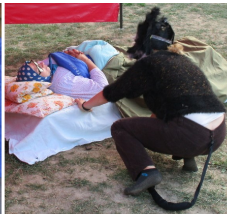
... když v tom se objeví vlk a babičku sežere ...