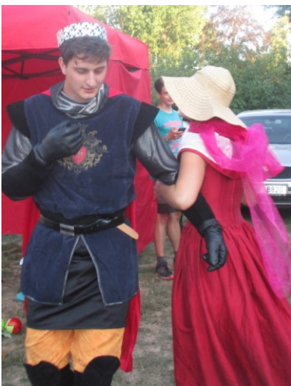
... taneček s princem ...