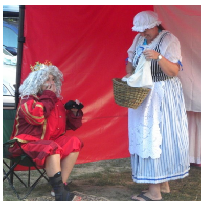
babka kořenářka u krále