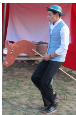
... zlý král ho poslal pro nevěstu ...