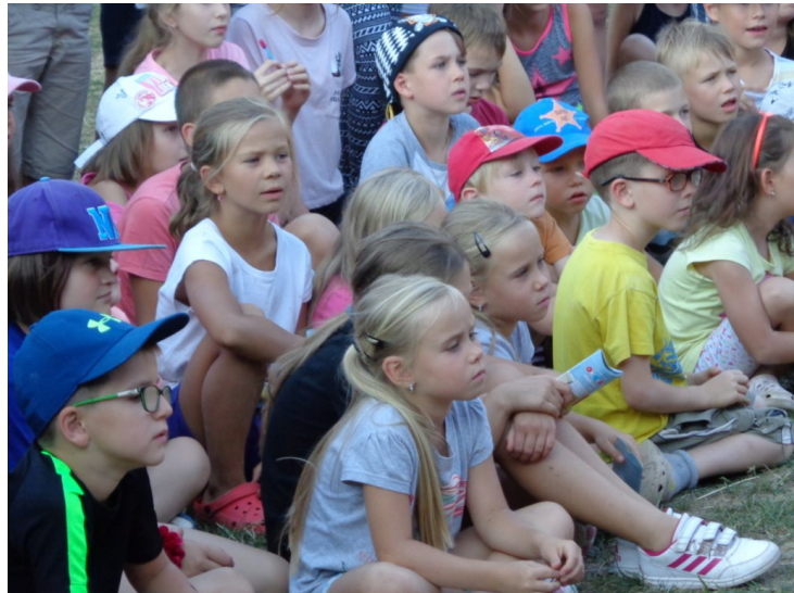
... a jak to dopadne? Vezme si ji?...