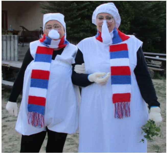
Křemílek a Vochomůrka