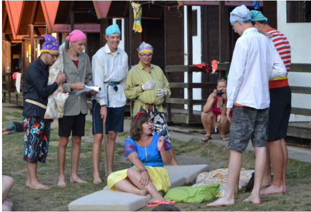
... Sněhurka se s nimi hned spřátelila ...