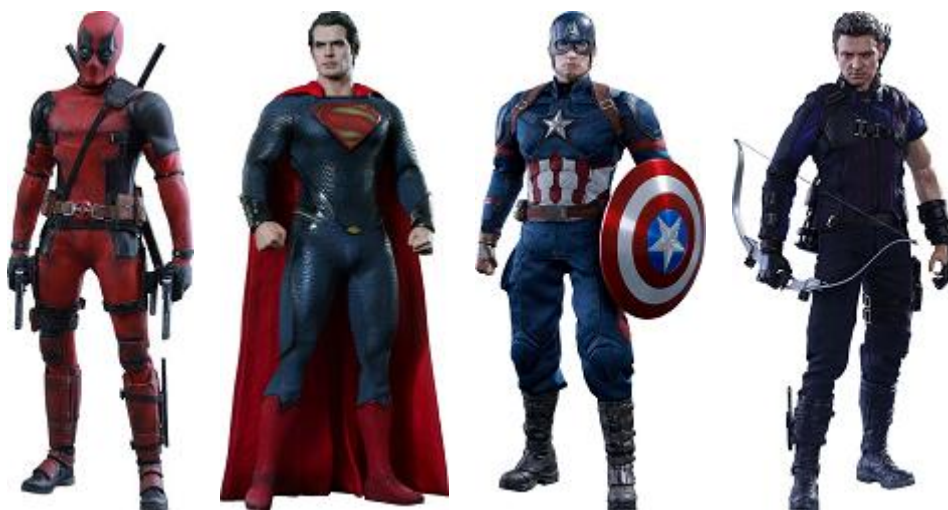
Černý jestřáb sestřelen