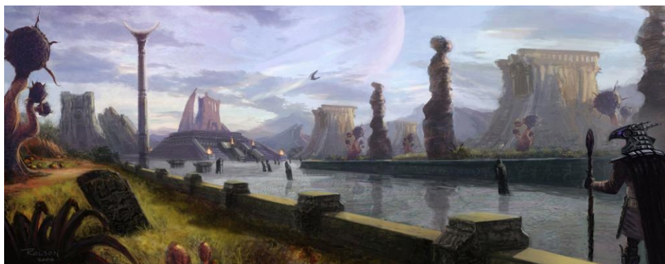
Zámeček Roželov MMXIII