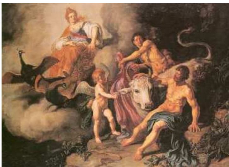
Juno přistihuje Jupitera s Ió (r. 1618)

Děti sedí kolem obřadního ohně. Na trůnu sedí Jupiter, který svolává ostatní bohy k poradě (úder hromu, obřadního gongu a pod). Bohové přicházejí a rozestaví se kolem obřadního ohně. Každý z bohů se představí (Jsem Neptun- bůh pramenité vody a moří). Do obřadního ohně vhodí obětinu (s kouřovým nebo jiným efektem). Postupně se představí všichni bohové a odejdou za trůn Jupitera. Po představení Jupiter seznamuje bohy s plánem giganta Porfyrióna o vzpouře proti všem bohům a žádá děti o pomoc při odhalení giganta. Můžeš si tam zamotat i nějak ty prcky.