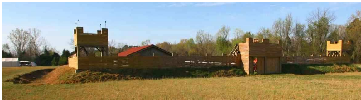
Rekonstrukce římského castra

Ze sedmé, osmé, deváté a desáté legie, devátá byla mezi nejstaršími legiemi v císařské římské armádě. Byli s Juliem Caesarem, když vtrhl do Galie r. 58 př. nl. Římský velitele zmiňuje devátou legii v boji proti Nervianům.