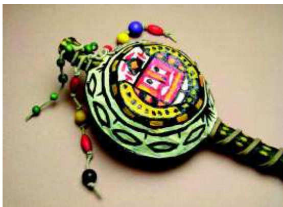
Chřestidlo z kaširované hmoty

Préríjní indiáni uctívají Matku Zemi, Hromu a Slunce.