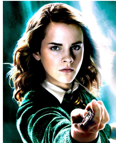
B. HERMIONA GRANGEROVÁ